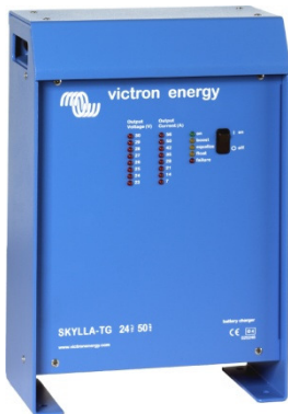
Cargador Skylla 24V 50A.