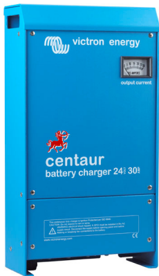
Centaur Battery Charger 24 30