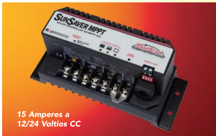
15 Amperes a 12/24 Voltios CC

El SunSaver MPPT es apto para uso a nivel profesional e individual. El proceso de control de carga está concebido para obtener máxima vida útil de la batería y alto rendimiento del sistema completo. La unidad está encapsulada en epoxi para protegerla contra las condiciones ambientales de servicio, el usuario puede regular su funcionamiento con cuatro selectores o conectándola a una computadora personal, y opcionalmente puede suministrarse con un instrumento de medición a distancia y sensor de temperatura de baterías.